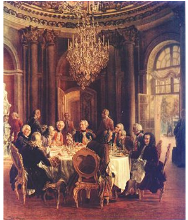
Adolph Menzel: König Friedrich II mit Voltaire und preußischer Geistes-Elite